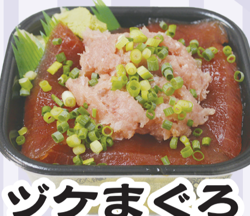
ツケまぐろ ネギトロ丼