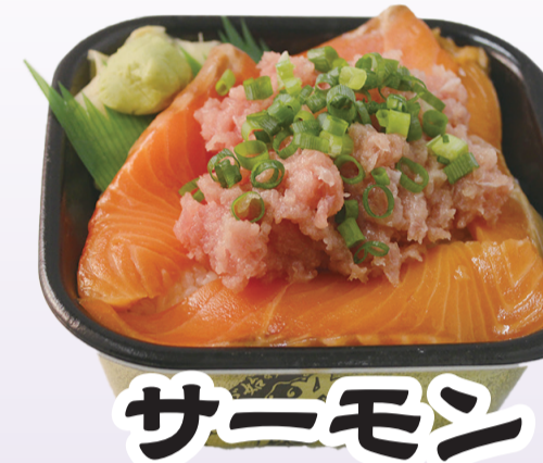
サーモン ネギトロ丼