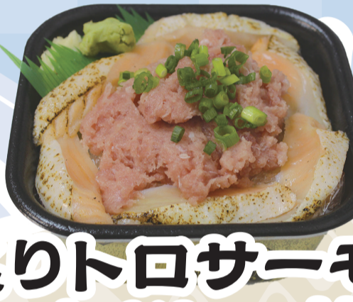
炙りトロサーモン ネギトロ丼