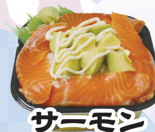
サーモン アボカド丼