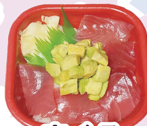
まぐろ アボカド丼