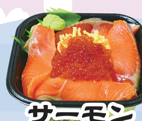
サーモン いくら丼