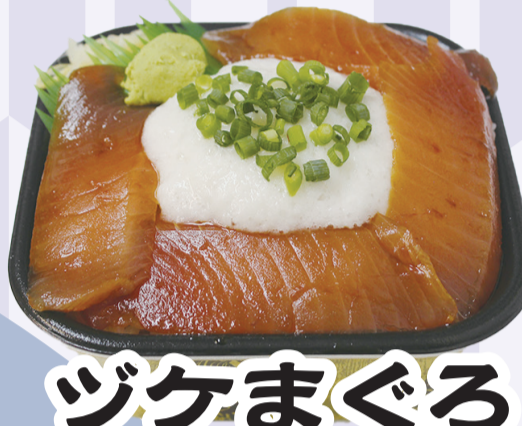
ツケまぐろ とろろ丼