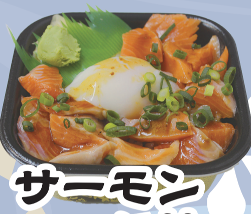
サーモン ユッケ丼