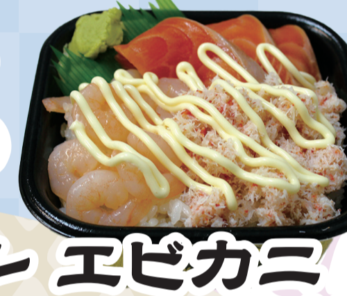
エビカニ サーモン丼