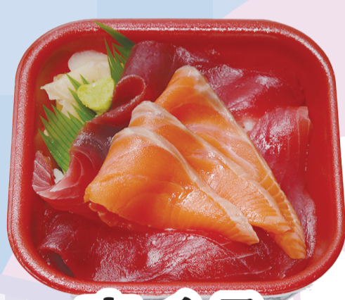
まぐろ サーモン丼