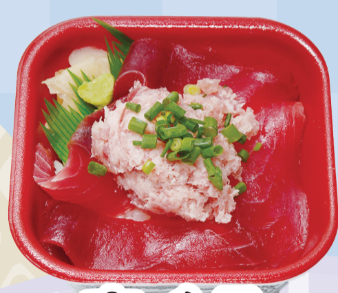
まぐろ ネギトロ丼