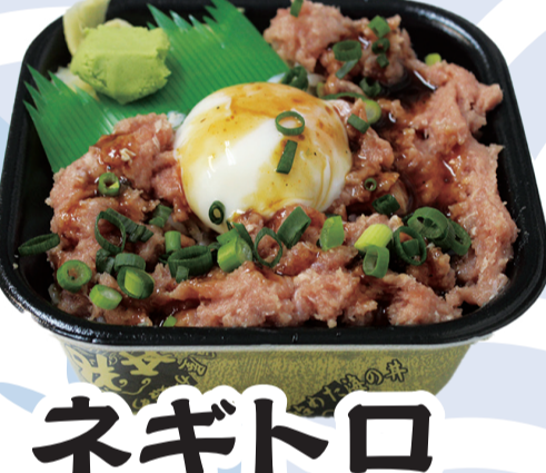
ネギトロ ユッケ丼