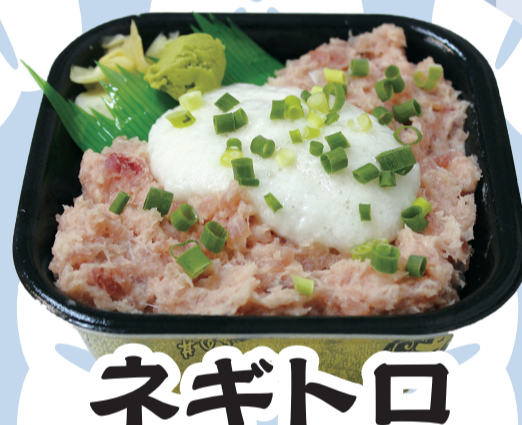
ネギトロ とろろ丼