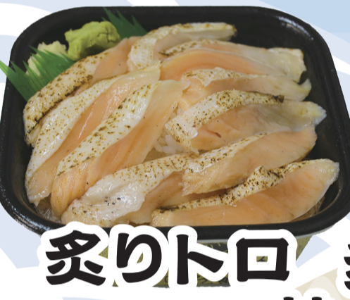
炙りトロ サーモン丼