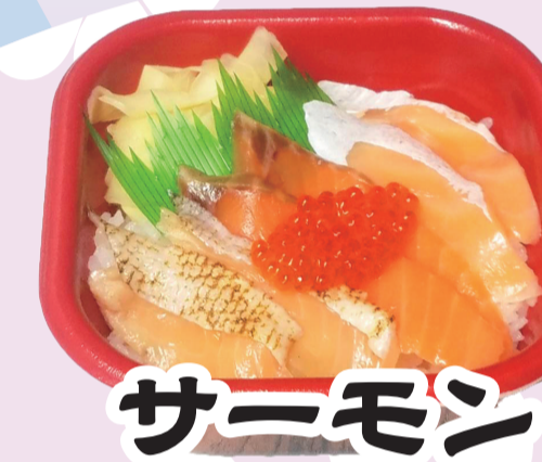
サーモン づくし丼